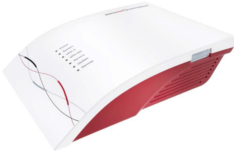
Abbildung 3: Anbringungsart der Gerätesiegel