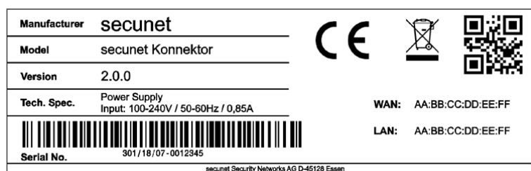
Abbildung 2: Beispiel für Typenschild

Öffnen Sie die Transportverpackung und vergleichen Sie die Seriennummer der Geräte und die MAC Adressen für LAN und WAN aus den Versandinformationen mit den Angaben auf dem Typenschild des zugelassenen secunet Konnektor. Das Typenschild des zugelassenen secunet Konnektor befindet sich auf der Geräteunterseite.